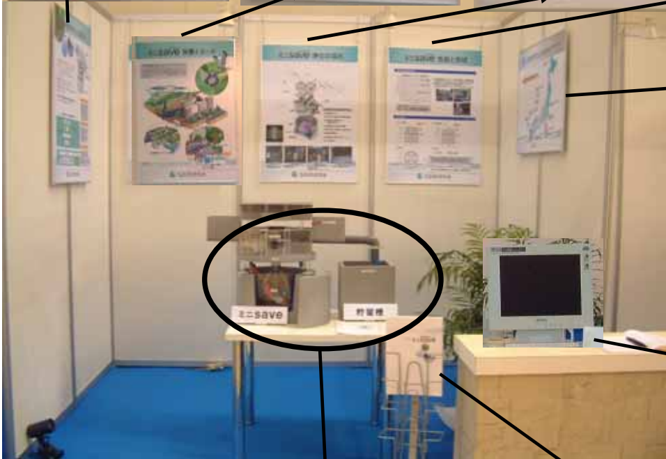
<パネル : save 研究会会員一覧>